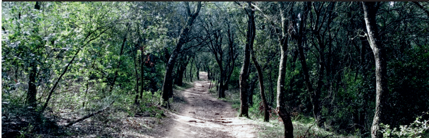
Descripción de la ruta / Ibilbidearen deskribapena